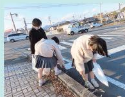
校外での清掃活動