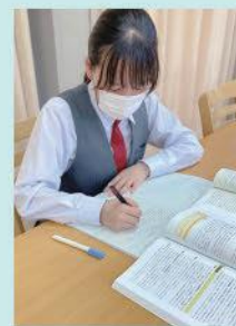
寮での学習の様子

入学してすぐはすべてのことが初めての ことばかりで毎日緊張していましたが、 同じ科の先輩に話を聞くことができたり、 同級生と仲良くなれたりして安心して 学校に通えるようになりました。家から 学校へ通う通学時間を考えると、寮に入 ったほうが勉強時間を確保できたり、部 活に専念できたりするので時間を有効に 使える寮に入るのをおすすめします。遠 方という理由で進路に迷っている人も、 津山東高校には寮があるので安心して ください。