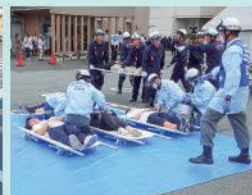
地域での防災訓練参加