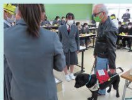
視覚障害者の理解